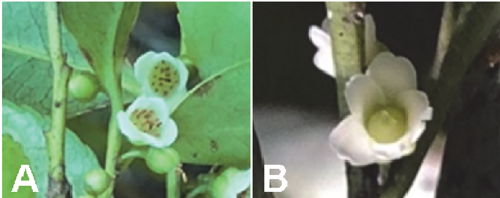
図 1. ムニンヒサカキ A : 雄花、B : 雌花

Fig. 1. Eurya boninensis . A: male flower, B: female flower.