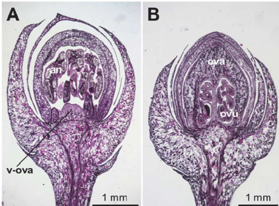
図 2. ムニンヒサカキの花の横断面 A : 雄花 (母島、サンプル番号 8)、B : 雌花 (母島、サンプル番号 1) an = 葯、v-ova = 機能を持たない子房、ova = 子房、ovu = 胚珠

Fig. 1. Eurya boninensis . A: male flower, B: female flower.