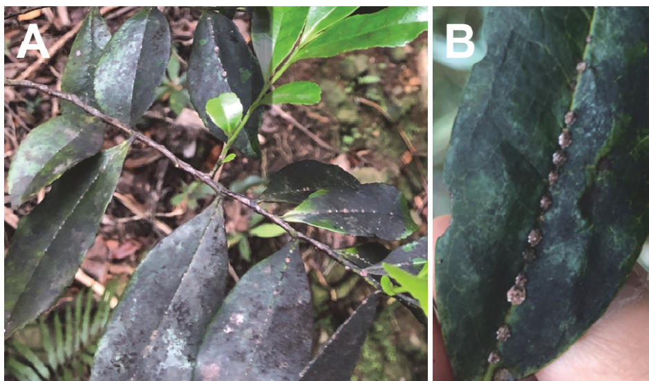
図 4.すす病に感染したムニンヒサカキの葉 (A) とカイガラムシ類 (B) Fig. 4. Sooty mold on leaves of Eurya boninensis (A), and Scale insects (B).

葉以外の多くの葉にはカイガラムシ類が付着していたため、新葉にもいずれはその被害が広がっていくと考えられる。本調査では、ムニンヒサカキ以外の植物のすす病の被害は把握していないが、東平と中央山ではすす病の蔓延が深刻であるため、希少種の個体数減少が危惧される。