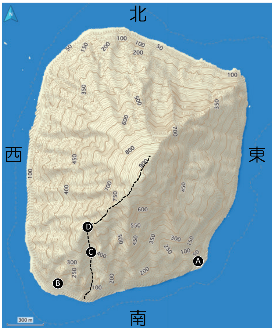
図2. 踏査ルート上によるネズミ類の観察地点