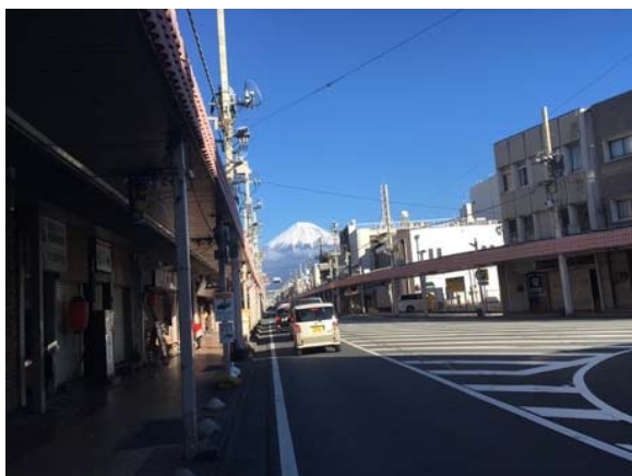
図2 依頼に応じて代行者が撮影した写真

Google フォームにて web アンケートを制作し、NPS (Net Promoter Score:他者推薦意向) や満足度を測る質問項目を用意し、アプリ利用後の評価について回答を得た。