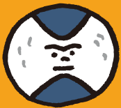
テキストデータ化