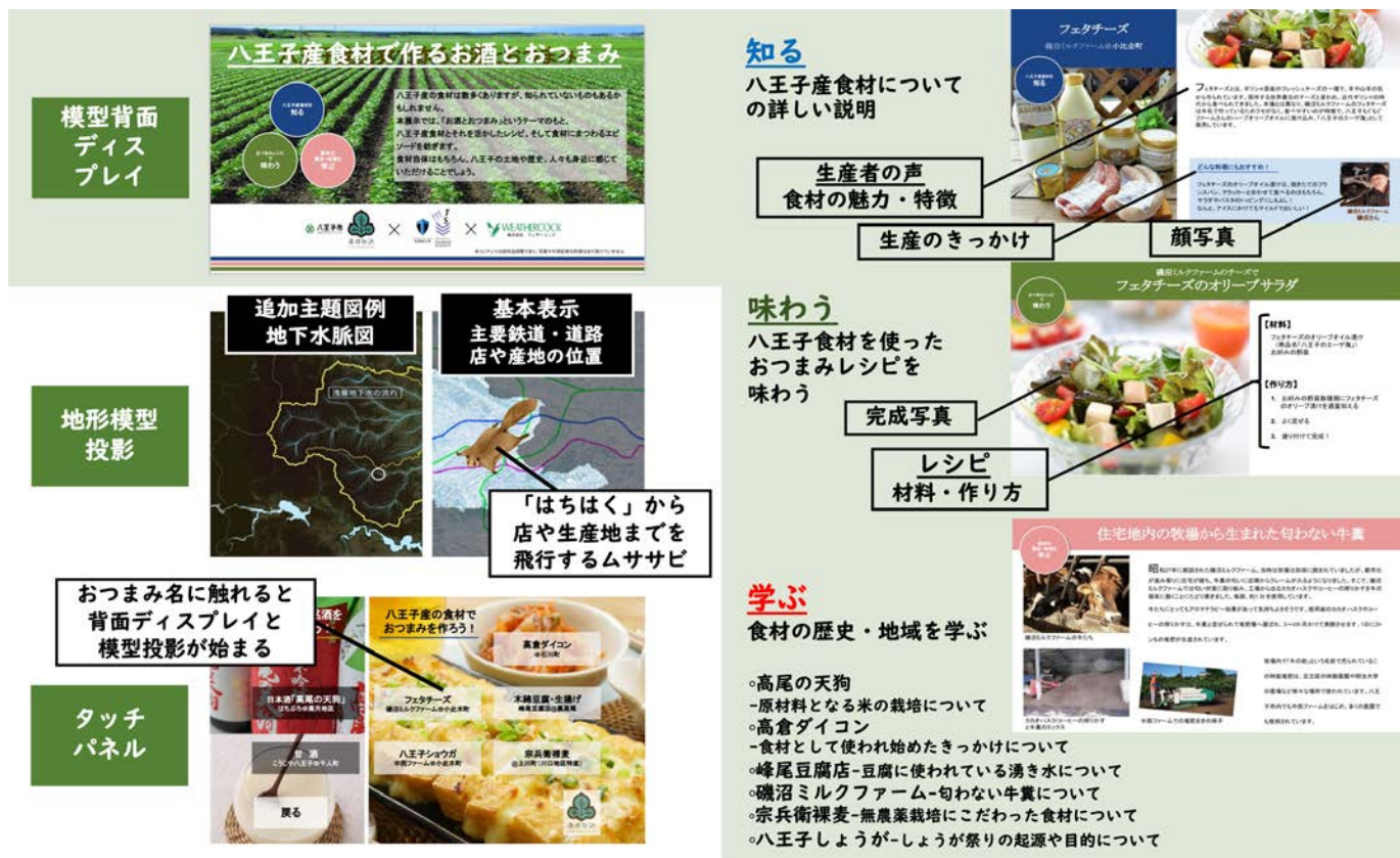
図3: はちはく「八王子産食材で作るお酒とおつまみ」展示における P+MM システムの表示箇所別の表示内容

模型背面ディスプレイには、「知る、味わう、学ぶ」の3スライドを表示する構成とした。「知る」では、食材や生産者の情報、「味わう」では料理写真とレシピ、「学ぶ」では、食材と地域の歴史、地形、文化資源との関係を解説している。観光行動、購買行動を促す工夫として、生産者の写真や動画ともに、生産者の語りを載せたり、写真やレシピを掲載した。また、地形模型への投影画像は、基本表示として衛星写真+主要道路・鉄道、店舗や生産地などの位置情報、および高尾山のシンボル動物であるムササビが「はちはく」から関連場所へ飛行するアニメーションをつけた。アニメーションは子ども等の関心を喚起する工夫でもある。また、背面ディスプレイの解説に合わせて、地下水脈図などの追加主題図が表示される。