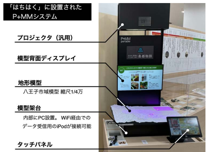
図1 使用した高精度ポータブル型P+MMシステムの構成

2020年度からの2つの試行の場を設けた。ひとつめは、【A】大学演習授業での活用実験である（2020年度～2022年度）。ふたつめは【B】日本遺産センター「はちはく」に設置するP+MMシステムで表示することを想定した観光振興視点のコンテンツ制作の実験である（2021年度～2022年度）。利用時の目標、制作過程での試行錯誤を授業記録や成果物、協議議事録や制作過程の議事録や制作物を振り返りながら、開発意図や工夫、課題や可能性を整理した。