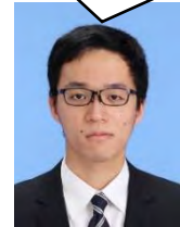
東京都立大学 地理環境学科 4年