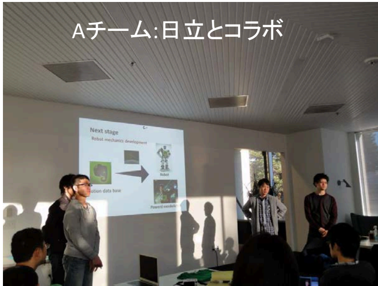
Aチーム:日立とコラボ