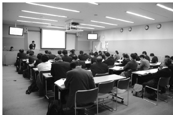
写真4 発表会場 (2)

本セッションの前半9編では、RCまたはPC造の柱梁接合部に関する発表がなされた。具体的には、機械式