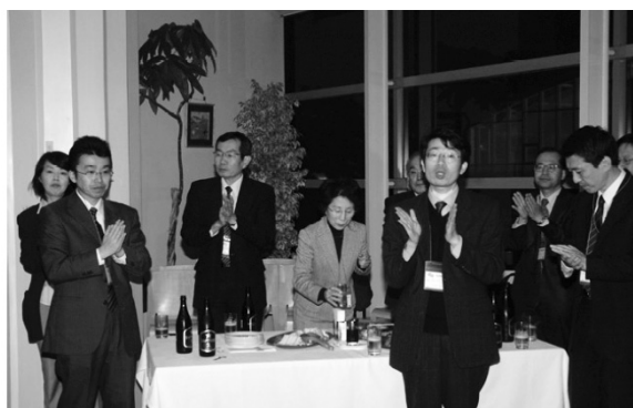
写真9 懇親会の様子(2)