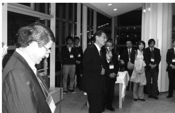
写真8 懇親会の様子(1)