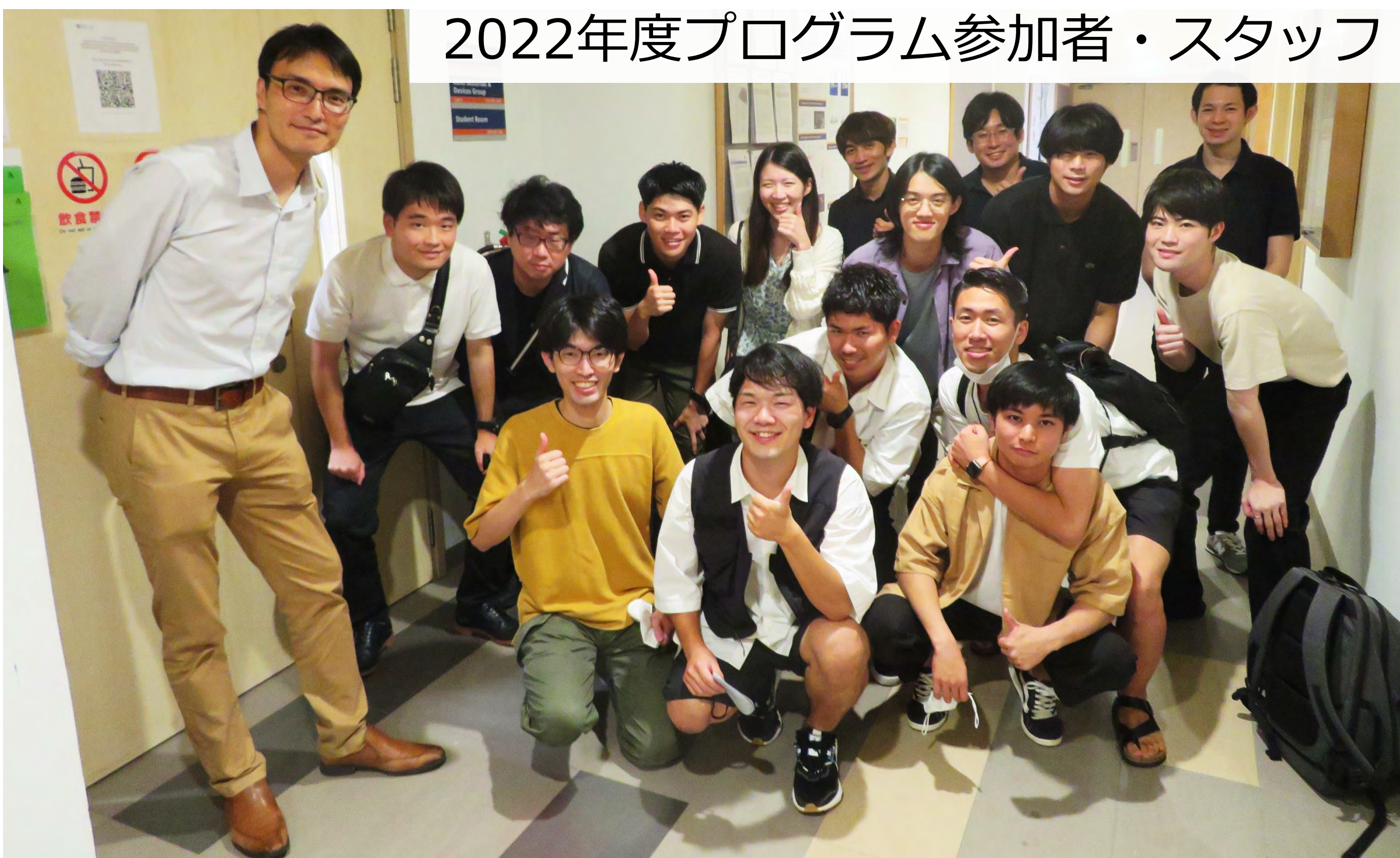
2022年度プログラム参加者・スタッフ