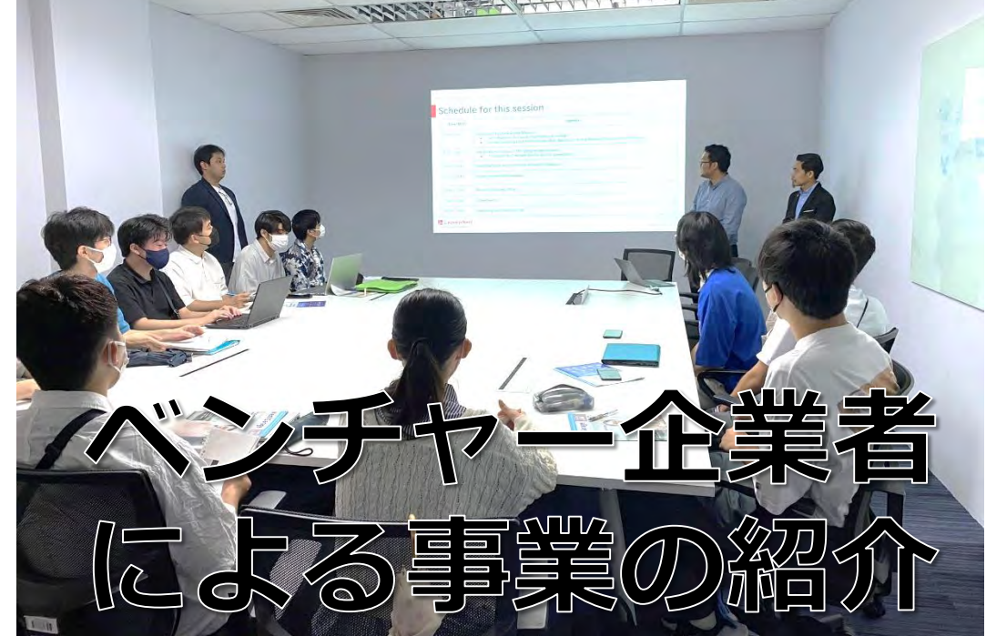
ベンチャー企業者 による事業の紹介