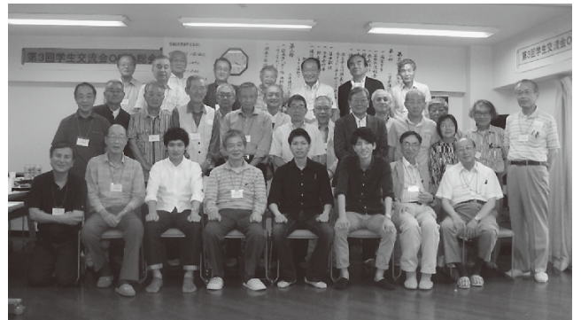
前列の若者3人は首都大学東京の現役学生