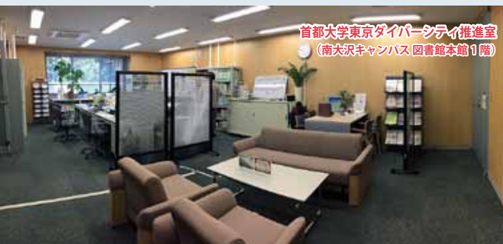
首都大学東京ダイバーシティ推進室 (南大沢キャンパス 図書館本館 1 階)

多様化する 21 世紀の魅力ある都市社会を、 新たな知の創造を追求するため、 首都大学東京では、 ダイバーシティ推進室を設置しています。