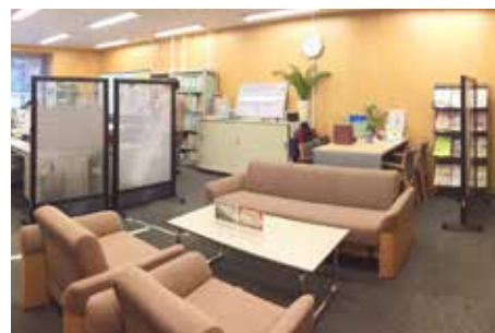
ダイバーシティ推進室 談話スペース