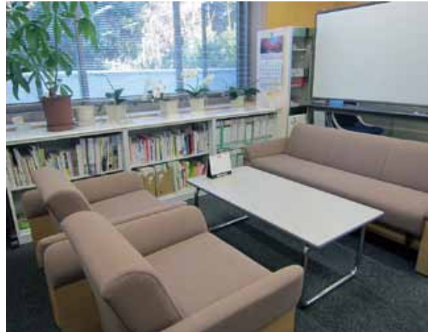
南大沢キャンパス図書館本館 1階ダイバーシティ推進室 談話スペース